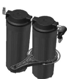
圖一．濾瓶套拆卸順時針拆