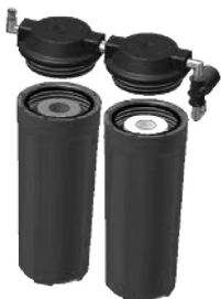
圖二．濾瓶套拆卸完成示意圖