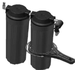
圖三．濾瓶套鎖動作緊示意圖